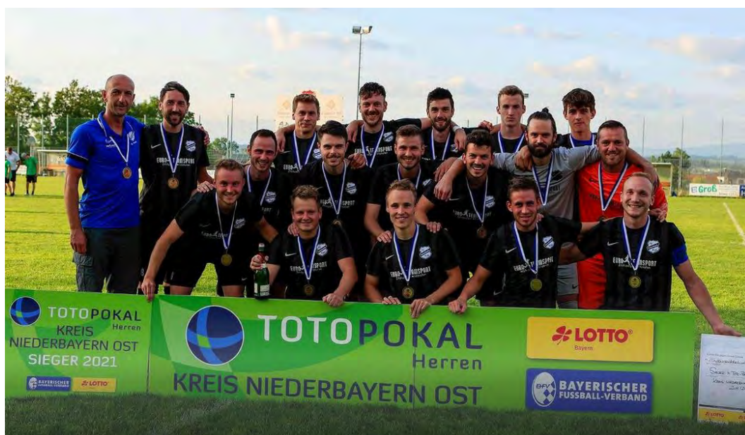
Kreispokal-Sieger Niederbayern Ost 2021: FC Tiefenbach DJK