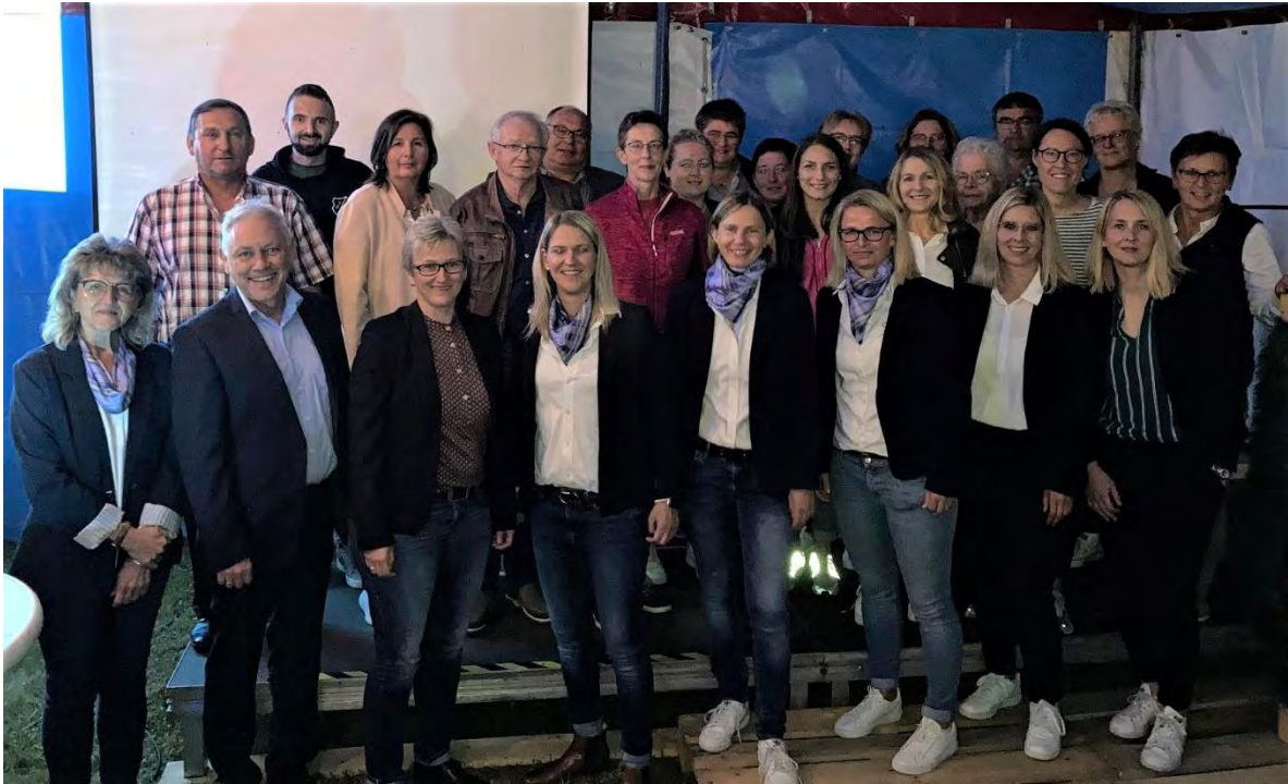
Ehrengäste bei der Festveranstaltung zum Jubiläum 50 Jahre Frauenfußball