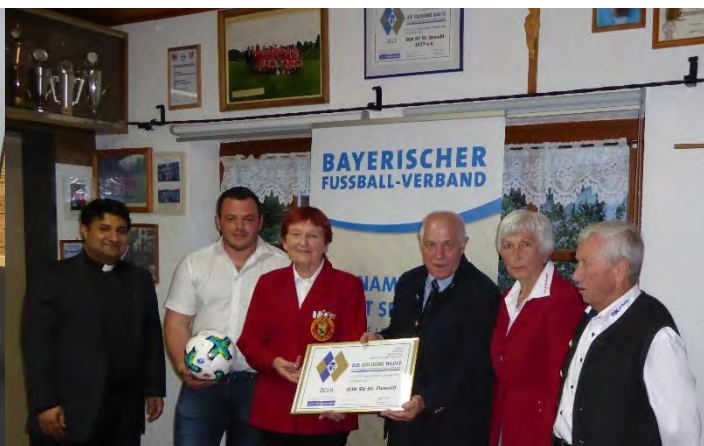
DJK-SV St. Oswald