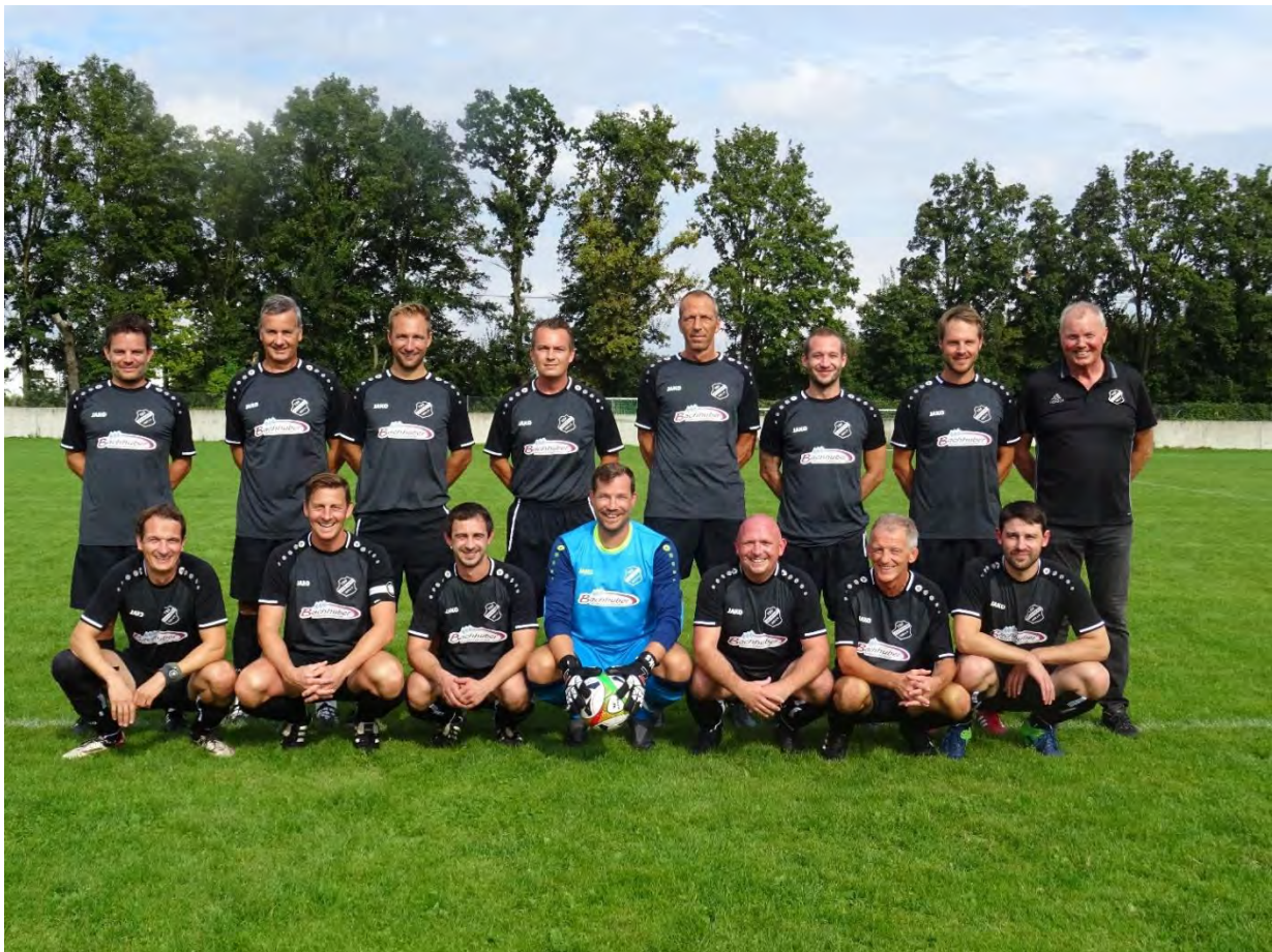
Der niederbayerische Serienmeister im Seniorenfußball: TSV Abensberg