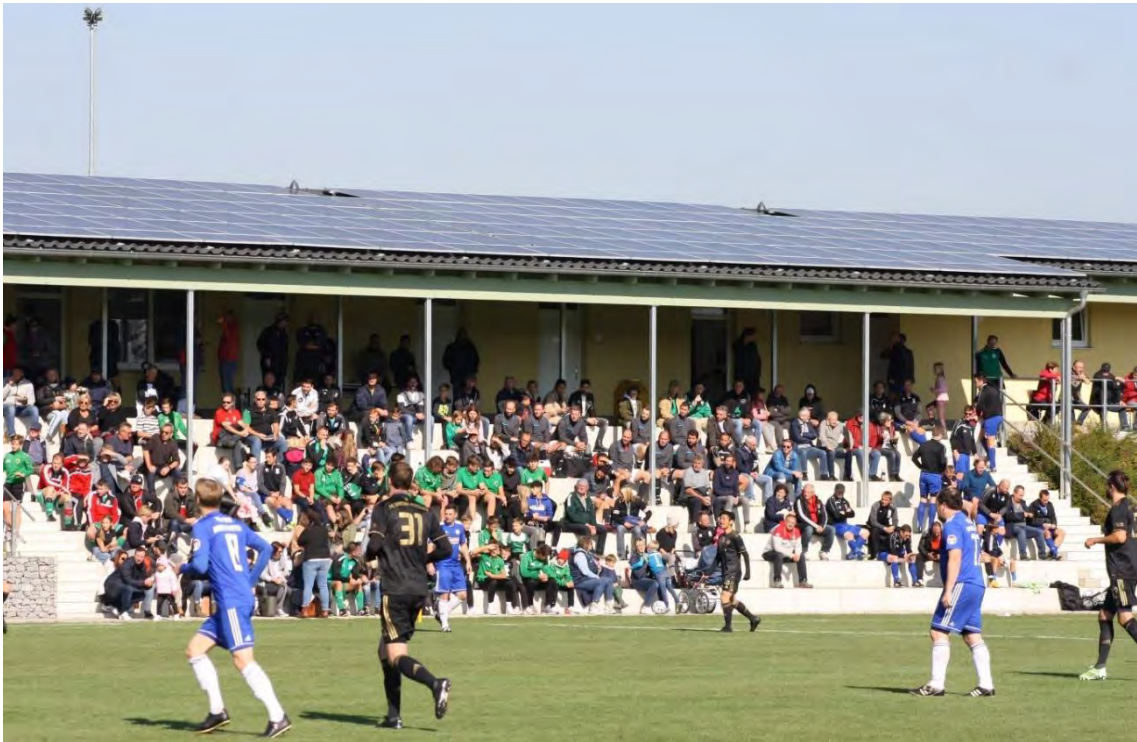
Vollbesetzte Tribüne bei der Bayerischen Meisterschaft der A-Senioren 2021 in Geisenhausen