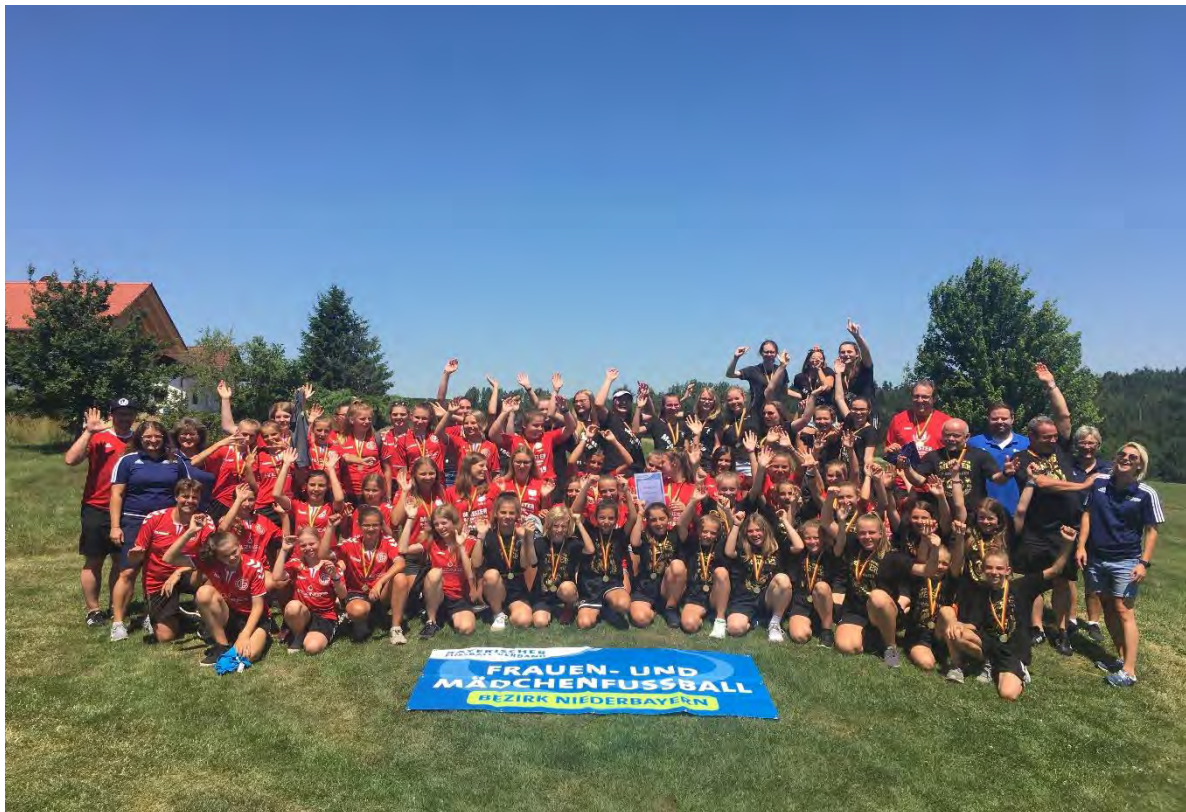
Meisterfeier der Juniorinnen 2019 im Soccerpark Willaberg

Die Meisterehrung der Juniorinnen findet seit Jahren im Soccerpark Willaberg statt. Zunächst stellen die Teilnehmer ihr fußballerisches Geschick beim Fußballgolf unter Beweis; nach einem gemeinsamen Mittagessen werden alle Meistermannschaften geehrt und erhalten eine Urkunde sowie Medaillen.