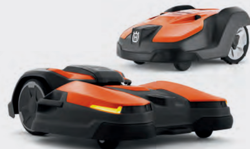
Automower® 550 und CEORA™ Mähroboter für den professionellen Einsatz auf Fußballplätzen