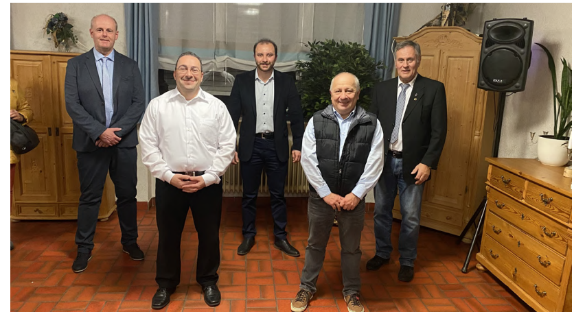
Vorstandsbesetzung der SRG-Aschaffenburg/MIL 2022 bis 2026