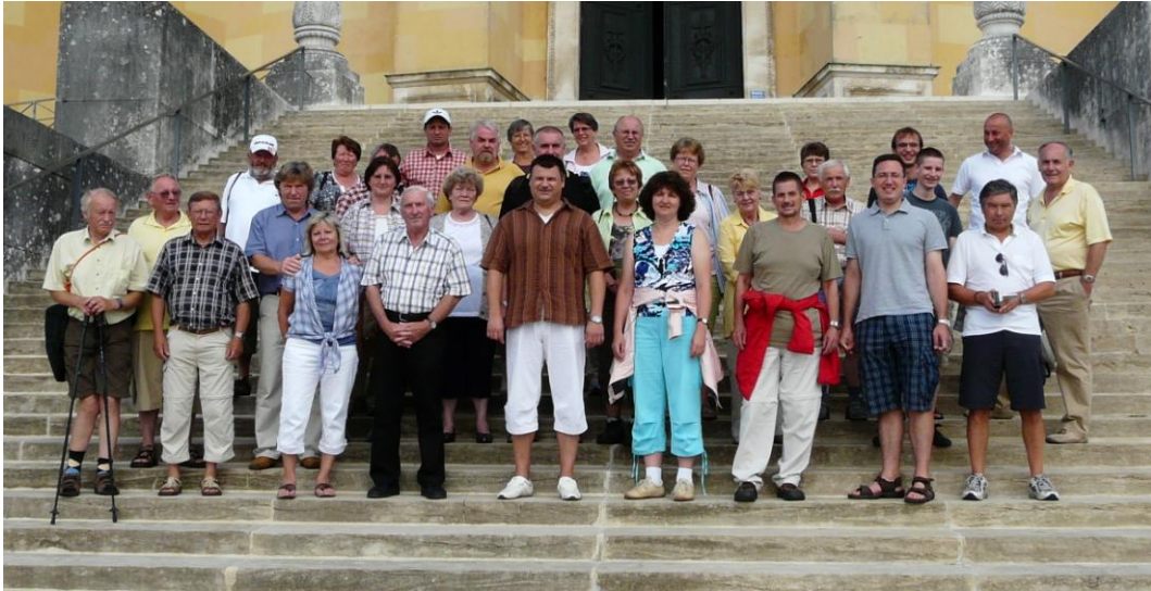
Die Reisegesellschaft versammelte sich zu einem Gruppenbild auf der Treppe zur Befreiungshalle.

Traditionsgemäß wird in der Schiedsrichtergruppe ein 2-tägiger Ausflug durchgeführt. In diesem Jahr war das mal anders, man holte den im Oktober 2009 ausgefallenen Wandertag nach. Mit dem Bus ging es zur Donau und zur Altmühl. Viel Glück hatten die Schiedsrichter mit dem Wetter, denn gerade an diesem Tag gab es ein Sonnenfenster bis zum späten Nachmittag.