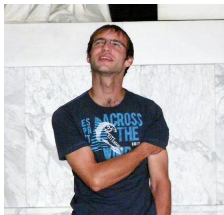
Ich seh' auch was!