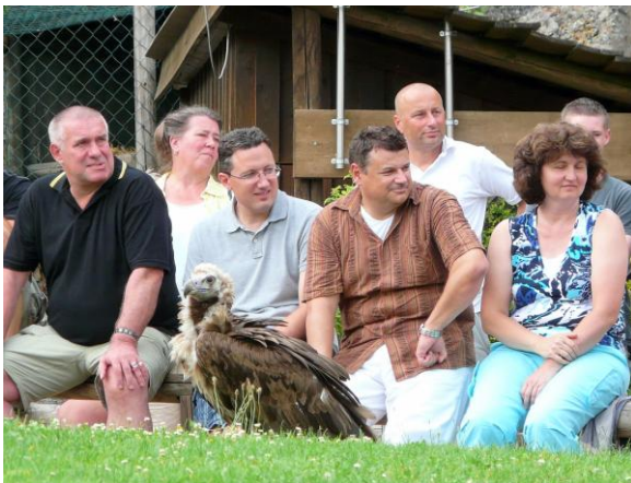
Was macht er jetzt, der Vogel?

Jeden Tag, außer Montag, um 11 und um 15 h werden dort die unglaublichen Flugkünste von Adler, Geier & Co. präsentiert. Das Falknerteam macht es möglich, die frei fliegenden Greifvögel hautnah zu erleben. Außerdem erfährt man viel Interessantes über die hohe Kunst der Falknerei und die charakteristischen Merkmale und Fähigkeiten der einzelnen Arten.