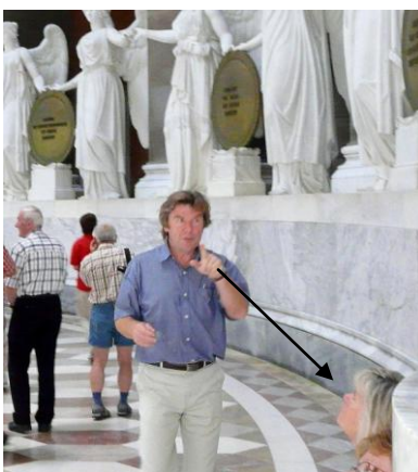
Da oben ist was!

Bei der Besichtigung gab es Interessantes zu entdecken.