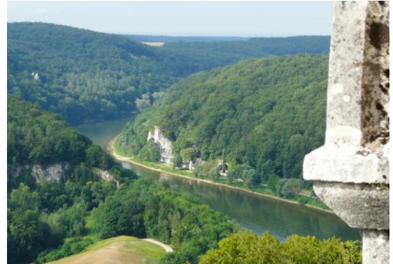
Blick von oben ins Donautal

Bei der Besichtigung gab es Interessantes zu entdecken.