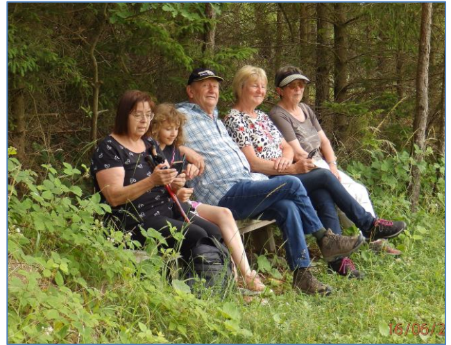
Im nahen Wald wurde bald eine Bank entdeckt!