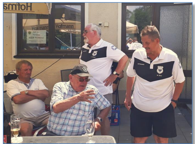
Bilder von: Gerhard Treuheit, Gerhard Hitz und Kevin Hegwein Text von: Gerhard Hitz