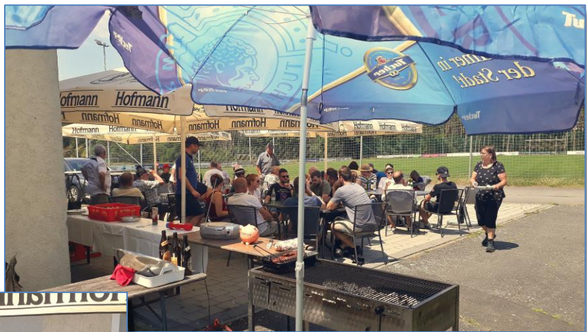
In geselliger Runde klang dann der Wandertag der SR-Gruppe aus.