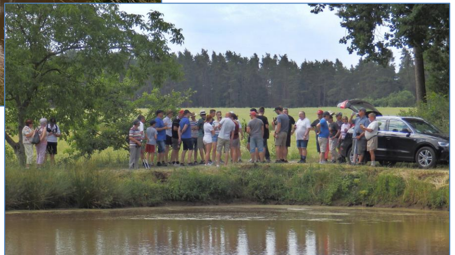
Noch ein Rückblick auf das Getränkefahrzeug und den Weiher. Und dann ging es in die 2. Etappe und die hatte es in sich!