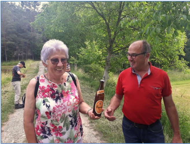
Und wer bekommt jetzt das Bier?