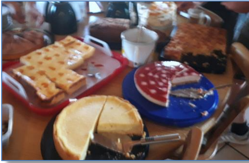
Zum Abschluss gab es noch Kaffee und Kuchen