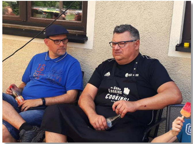
Der Grillmeister konnte sich endlich erholen.