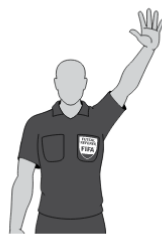
Fünftes kumuliertes Foul