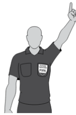
4 Sekunden zählen (1)