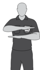
Kumuliertes Foul nach Vorteil (2)