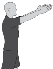
Vorteil kumuliertes Foul