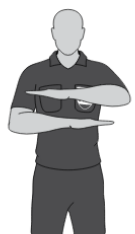
Kumuliertes Foul nach Vorteil (1)