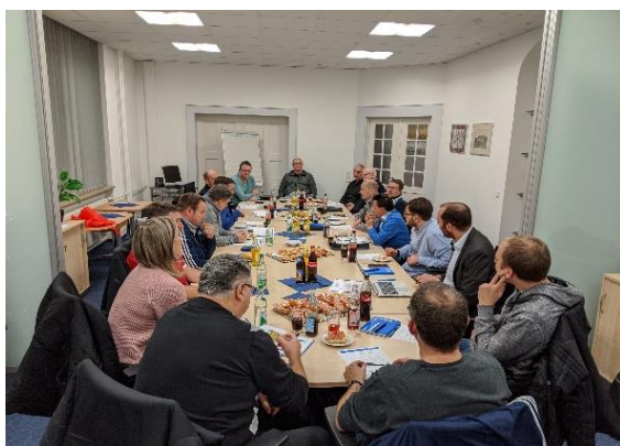
(Der VSA im Gespräch mit dem KSA in der BFV-Geschäftsstelle Nürnberg)